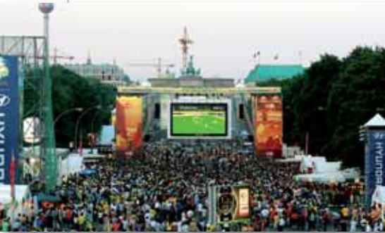
LES ANIMATIONS EN dehors des stades sont une des données essentielles de la candidature.

développer ce concept pour faire de la compétition un événement de plus en plus populaire et festif. Ces zones officielles sont un fabuleux recours, presque « un deuxième stade », pour accueillir les supporters qui n'ont pas trouvé de billets dans un cadre de fête favorisant les échanges à travers la passion commune du football. Hormis la diffusion des rencontres, elles sont équipées de scènes offrant aux spectateurs des divertissements culturels, musicaux ou sportifs pour animer l'avant et l'après-match. Placées dans un lieu central, généralement sur une grande place, elles devront être présentes dans toutes les agglomérations hôtes de l'Euro 2016. La capacité à présenter des projets innovants en la matière sera un élément déterminant pour décrocher la timbale.