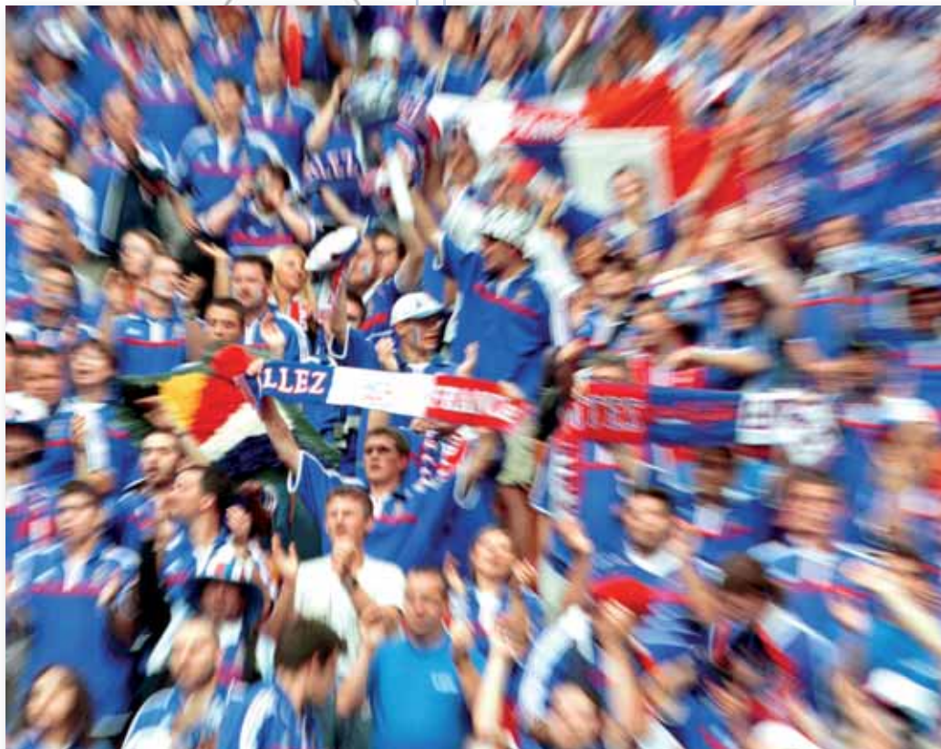
LE SOUTIEN POPULAIRE à la candidature jouera un rôle dans la désignation du pays hôte.