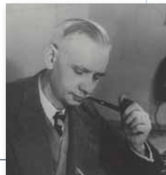
HENRI DELAUNAY, LE père de l'Euro de football.