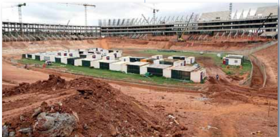
L'EURO 2016 NÉCESSITERA la construction ou la rénovation d'au moins neuf stades.

Des critères détaillés dans le cahier des charges de 500 pages. Quelques exemples suffisent à comprendre les attentes de l'UEFA. Chaque stade doit